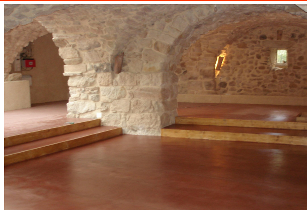
salle couverte (80 places env.)